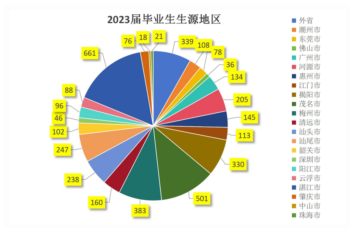
饼图一 2023 届毕业生生源地区分布